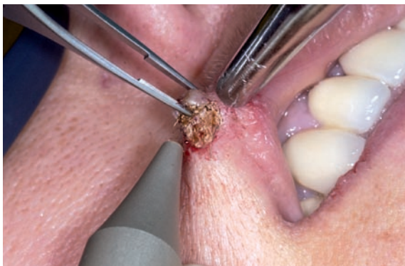
Es erfolgte eine Oberflächenanästhesie mit EMLA Creme (AstraZeneca, D-Wedel), eine örtliche Infiltrationsanästhesie und dann die Excision der Warze mit einem CO 2 -Laser bei 3 Watt CW Superpulsed. Die Dauer des Eingriffs betrug etwa zwei Minuten.