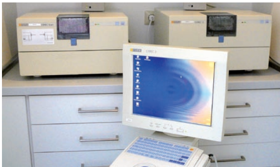
Im Laserzentrum erhalten Patienten auch CAD/CAM-Versorgungen.

die Fertigungseinheiten CEREC 3 und inLab, sodass bei Quadrantensanierungen ein zügiger Arbeitsfluss gewährleistet ist. Aktuell werden die Software-Versionen 3.04 für CEREC und 2.6 für inLab verwendet. Die Restaurationen werden aus VITABLOCS Mark II (VITA Zahnfabrik, D-Bad Säckingen) geschliffen. Die Individualisierung erfolgt im praxiseigenen Labor durch eine Zahntechnikerin, die ebenfalls in die CAD/CAM-Verfahren eingearbeitet ist.