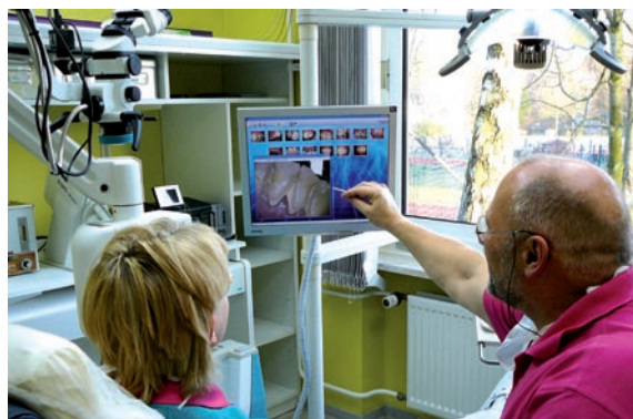
Das Konzept der „Co-Diagnostik“ stärkt das Vertrauen des Patienten in die Behandlung.

digitalen Intraoralkamera (Orangedental, D-Biberach) und werden gemeinsam mit dem Patienten für eine „Co-Diagnostik“ begutachtet. Hierbei hilft eine entsprechende Software mit Lupenfunktion, mit der beispielsweise defekte Füllungsänderungen deutlich sichtbar werden. Durch diese Methode wird bei dem Patienten größeres Vertrauen in die vorgeschlagene Behandlung erzielt, denn er hat mit eigenen Augen gesehen, dass Handlungsbedarf besteht. Röntgenbilder werden mit einem Gerät der Orthoralix-Serie von Gendex (KaVo Dental, D-Biberach), das nachträglich digital aufgerüstet wurde, erstellt. Farbausdrucke der Fotografien und Röntgenaufnahmen werden dem Patienten nach dem Erst-Gespräch in einer Beratungsmappe mitgegeben. Terminerinnerungen erhalten Patienten auf Wunsch übrigens per SMS.