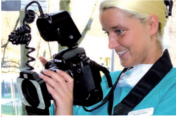
Mit einer professionellen Kameraausrüstung werden Behandlungen dokumentiert.

die Fertigungseinheiten CEREC 3 und inLab, sodass bei Quadrantensanierungen ein zügiger Arbeitsfluss gewährleistet ist. Aktuell werden die Software-Versionen 3.04 für CEREC und 2.6 für inLab verwendet. Die Restaurationen werden aus VITABLOCS Mark II (VITA Zahnfabrik, D-Bad Säckingen) geschliffen. Die Individualisierung erfolgt im praxiseigenen Labor durch eine Zahntechnikerin, die ebenfalls in die CAD/CAM-Verfahren eingearbeitet ist.