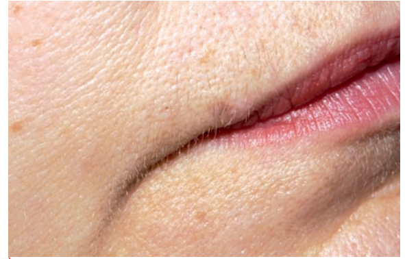
Das Ergebnis sieben Wochen post OP.

Er:YAG-Laser, also Hartgewebelaser, die eine Wellenlänge von 2.940 nm aufweisen, bieten zahlreiche Anwendungsmöglichkeiten. Hierzu gehören