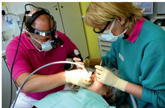
Laserbehandlungen werden von den Patienten sehr gut angenommen.