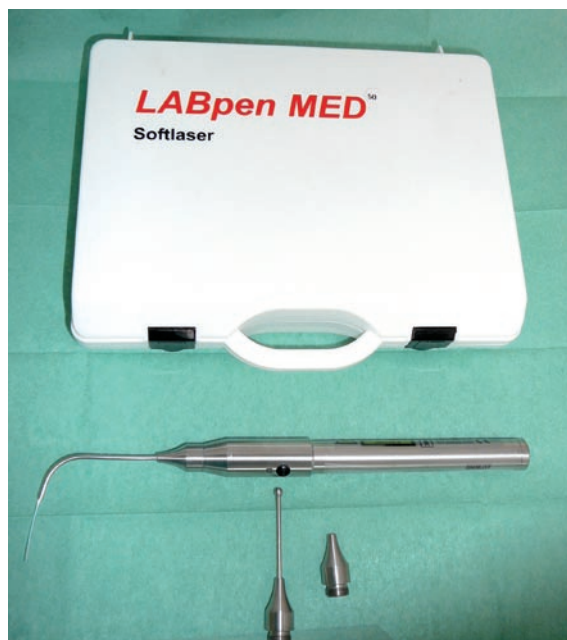
Im Laserzentrum kommen verschiedene Therapielaser zum Einsatz, unter anderem der LABpen® MED 50.

den LABpen® MED 50 (Medizin Technik Behounek, A-Graz) und den LASOTRONIC Med-200 DUO (LASOTRONIC, H-Budapest). Der LABpen® MED 50 arbeitet mit einer Leistung von 50 mW und mit der Wellenlänge 660 nm. Nur bei dieser Wellenlänge wird Sauerstoff abgespalten. Der LASOTRONIC Med-200 DUO bietet sowohl die Emittierung von sichtbarem roten Licht (Wellenlänge 660 nm) als auch von unsichtbarem infrarotem Laserlicht (Wellenlänge 805 nm) und somit zwei unterschiedliche Eindringtiefen.