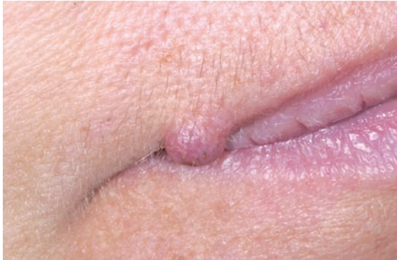
Warze am rechten Oberlippenrand einer 45-jährigen Patientin.

Wird der CO 2 -Laser defokussiert angewendet, kann flächig koaguliert oder abgetragen werden.