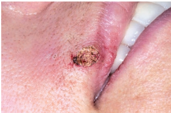
Die Situation direkt nach der OP.