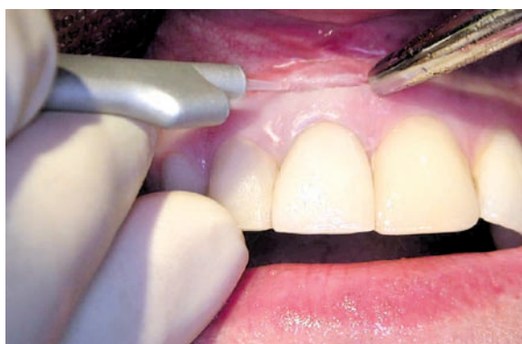
Laserschnitt mit Er:YAG-Laser für Wurzelspitzenresektion.